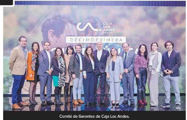
Comité de Gerentes de Caja Los Andes.