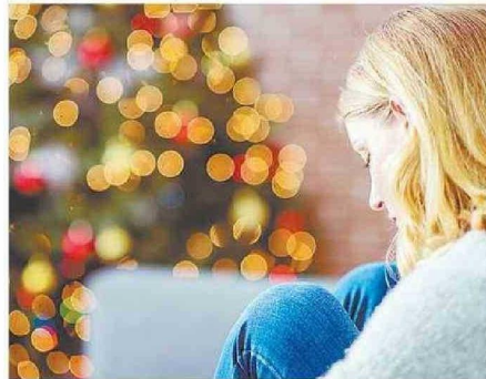
BRINDAR COMPAÑÍA A QUIEN VIVE UN DUELO POR ESTAS FECHAS.

Muñoz aboga por rituales: “Ayudan a sostenernos. Prender una velita. El escribir una carta, decir