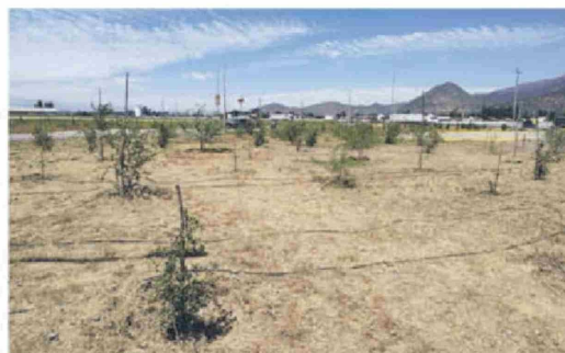
Proyecto de paisajismo sustentable "Reforesta - Cápsulas de Bosque en la Ciudad" en distintos enlaces de Ruta del Maipo, realizado en conjunto con Fundación Circular, representando una contribución a la regulación del clima en la zona.