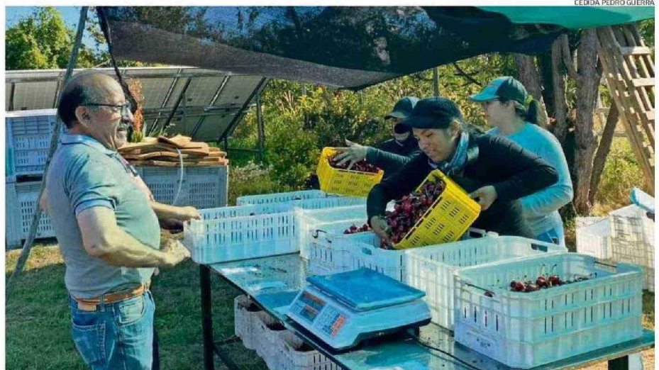
TRALCAO ES UNA DE LAS ZONAS DE LA REGIÓN DE LOS RÍOS EN DONDE SE PRODUCE CEREZA QUE ES EXPORTADA.

evaluación comercial, como todo producto agrícola ha tenido sus vaivenes, años buenos y otros no tan buenos. Los años de pandemia fueron muy difíciles, el año pasado fue bastante bueno y este año aún no termina, porque la producción de nosotros es tardía, eso significa que los volúmenes en estos momentos recién están llegando a China”.