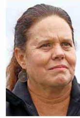
Maya Fernández , ministra de Defensa

El dilema en torno a estos movimientos se intensifica aún más con una posible salida de la ministra Maya Fernández, quien enfrenta un complicado