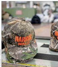
LAS VENTAS de los gorros subieron tras la convención.

de esto: Harris aventaja a Trump por 48,4% contra 46,9%, según el promedio de estudios del sitio especializado RealClearPolling.com.