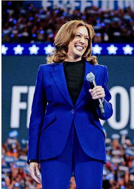
HARRIS HA DICHO que Trump es una persona "poco seria".

Pese a lo que diga el exmandatario, es indiscutible que Harris emergió de la convención con un fuerte impulso que parecía improbable para los demócratas hace un mes, cuando el Presidente Joe Biden seguía en carrera. El salto de la vicepresidenta a la primera línea rejuveneció el partido y les dio un golpe de optimismo, según The New York Times. Las encuestas dan cuenta