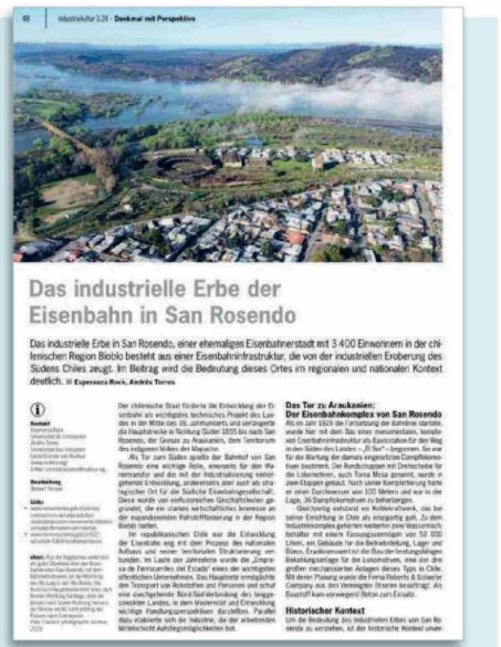
EL FACSIMIL CON LA PUBLICACION en la revista alemana de divulgación científica IndustrieKultur sobre el patrimonio industrial de San Rosendo.