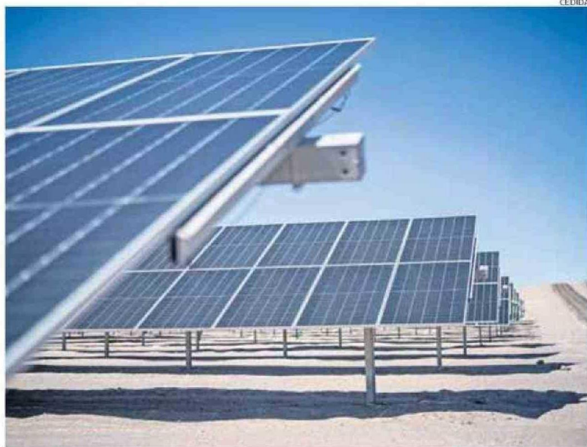
LOS PROYECTOS ENERGÉTICOS TOMARON LA DELANTERA EN EL 2024 EN CUANTO A LOS MONTOS DE INVERSIÓN.

Respecto de la capacidad que tiene el Servicio de Evaluación para calificar esta inédita cantidad de nuevos proyectos, la autoridad sostuvo que “las empresas saben que el SEIA tiene reglas claras y da certezas. Así mismo, deseo resaltar la experiencia y alta capacidad profesional que tienen los funcionarios y funcionarias del SEA Antofagasta, los que están plenamente capacitados para tramitar estos proyectos y los que vendrán”.