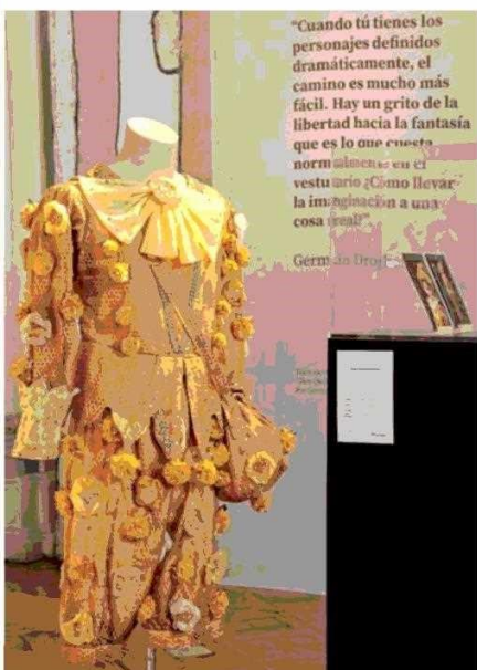
En el Taller de Vestuario y Caracterización encontraron el traje que diseñó para Taumanchen, de Hansel y Gretel .