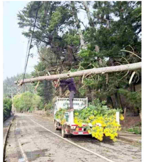
El Municipio ha trabajado para retirar los árboles caídos.