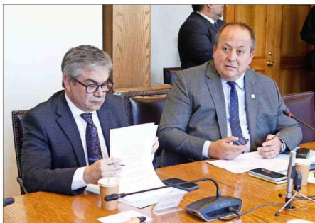
El ministro de Hacienda, Mario Marcel, se reunió ayer con el fiscal nacional, Ángel Valencia, en La Moneda, junto con el subsecretario del Interior, Luis Cordero, quien ofició de anfitrión del encuentro (foto archivo).

Eso que la ministra llamó efecto 'rebote' tiene que ver con que en el presupuesto hay transferencias consolidables, que son recursos que salen de una institución, pero se van a otro servicio público.