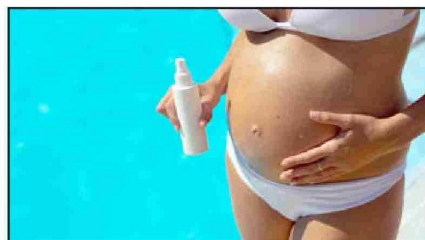
Entregan recomendaciones para que el verano no sea una temporada difícil para las embarazadas. (Imagen referencial).

«Siguiendo estas recomendaciones, pueden disfrutar de esta etapa tan especial mientras protegen su bienestar y el de su bebé. El cuidado empieza con la información, por lo que deben consultar con su médico de confianza ante cualquier inquietud», finalizó.