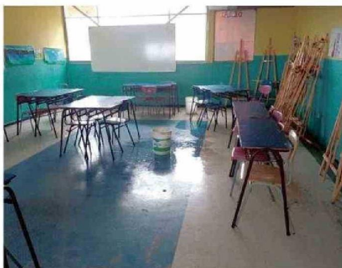
SALAS HÚMEDAS Y ESPACIOS FRÍOS: LA REALIDAD DE LOS LICEOS.