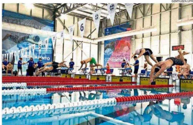
EN EL PROGRAMA DE LA COMPETENCIA SE INCLUYERON PRUEBAS DE DISTINTOS ESTILOS.