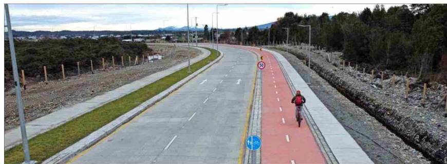
CALIDAD. — Advierten que no es solo necesario construir más, sino que las que existen cumplan estándares. En la foto, una ruta de Puerto Montt.