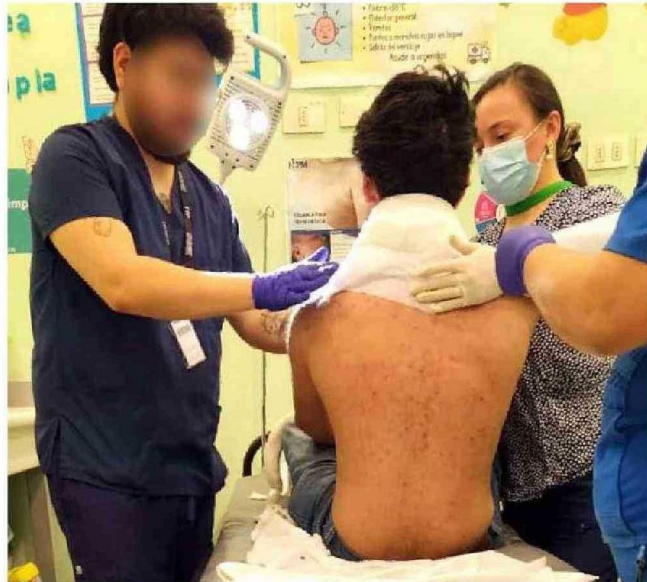
EL MOMENTO EN QUE EL ESTUDIANTE RECIBE ATENCIÓN MÉDICA POR LAS QUEMADURAS EN EL CUELLO.

De forma paralela, este medio accedió a un comunicado emitido por la Dirección a los apoderados del liceo. En él se expresa que "se tomarán todas las medidas necesarias con