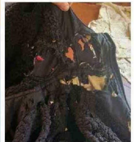
LA ROPA QUEDÓ DESTRUIDA.

quienes resulten responsables de traer este tipo de artefactos, que son un peligro para la comunidad educativa".