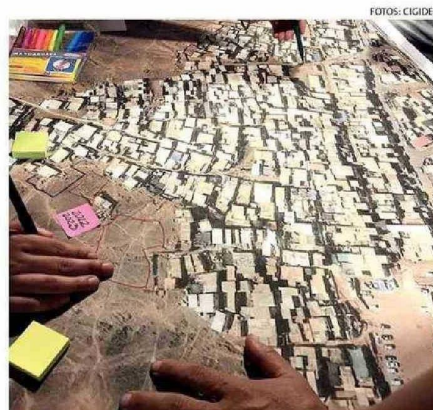
PARA RECOLECTAR DATOS SE REALIZÓ UNA CARTOGRAFÍA PARTICIPATIVA.

"Se identificó una alta variabilidad estructural de las viviendas en un área acotada. Sumado a esto, se identificó una preocupante distribución aleatoria de las viviendas, conformándose estrechos pasajes, estructuras de escalera, y algunas zonas pavimentadas que implican cambios que son muy complejos de cuantificar e impiden una efectiva determinación de la capaci-