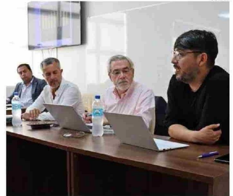
PRESENTACIÓN DE LOS RESULTADOS DE LA ENCUESTA.

Consultado sobre las tareas que se presentan a las actuales autoridades regionales, definió que “tienen que trabajar para disipar las dudas que puedan existir respecto de la institución del Gobierno Regional. Porque las dudas no son una condición favorable para