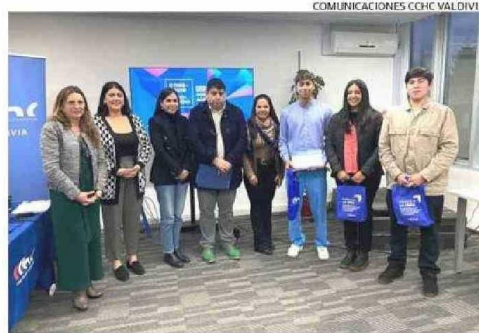
EN LA IMAGEN LOS JÓVENES GANADORES DE LA CONVOCATORIA LOCAL.