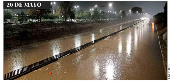
20 DE MAYO Hace menos de un mes, el mismo tramo se vio anegado, impidiendo la circulación de vehículos cuando habían caído 30 mm de lluvia.