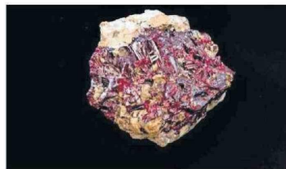
ROSCICLER DE PLATA ENCONTRADO EN CHAÑARCILLO EN LA MINA LA DESCUBRIDORA, COLECCIÓN DEL MUSEO REGIONAL DE ATACAMA.

bien la minería tiene una extensión en todas partes del mundo, la metalurgia en Atacama es el inicio de la metalurgia en Chile".