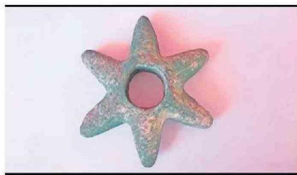
MARTILLO DE COBRE PRODUCTO DE LA MINERÍA PREHISPÁNICA, ENCONTRADO EN LAS CERCANÍAS DE VIÑA DEL CERRO.