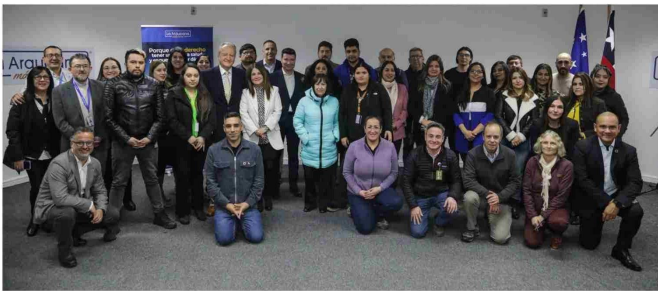
Lanzamiento del programa "Tu Salud Más Cerca", con trabajadores.