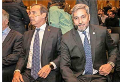
Los expresidentes Jorge Quiroga (Bolivia) y Mario Abdo (Paraguay).