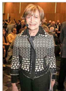
Evelyn Matthei, alcaldesa de Providencia.