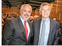
Los expresidentes Iván Duque (Colombia) y Mauricio Macri (Argentina).