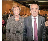
Maritza Larraechea y el expresidente Eduardo Frei Ruiz-Tagle.