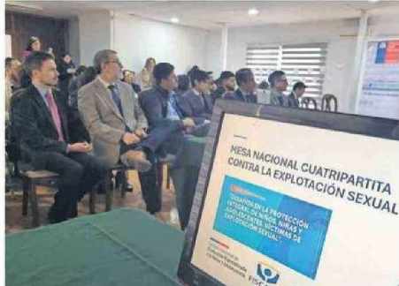
LA ACTIVIDAD DE LA FISCALÍA.