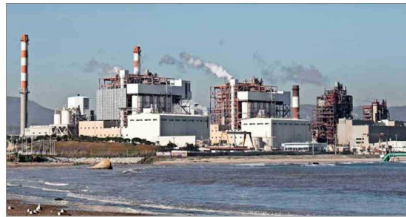
Programa de Recuperación Ambiental y Social es uno de los programas que evalúa anualmente la Dipres.

Y si bien se plantea que existe una correcta vinculación entre el objetivo a nivel de fin y de propósito, cuestiona que la definición del componente de asesoría técnica para el desa-