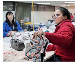
Otro de los programas cuestionados es el Sence, que implica recursos públicos por US$17 millones.

Se analizaron casi 700 programas ad portas del presupuesto 2025