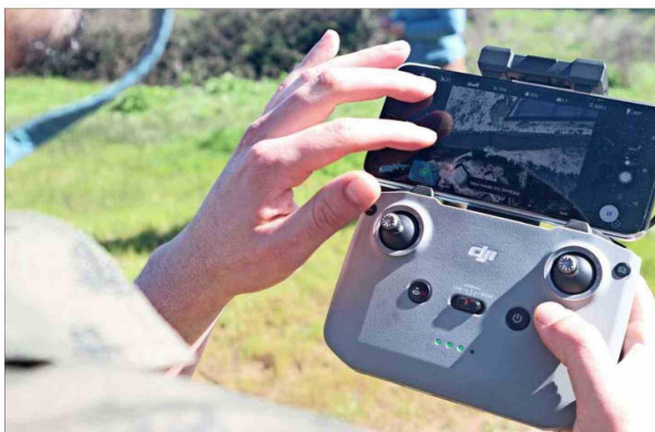
Una de las formas con las que entrenaron a los algoritmos de IA fue con fotos de alta resolución de la bahía de Quintero tomadas por dron.

Sin embargo, las técnicas tradicionales son lentas y costosas. "La bahía de Quintero es grande, son cerca de 5 kilómetros por 3 kilómetros. Entonces, hacer estudios de prospección arqueológica (técnicas y métodos que los arqueólogos utilizan para localizar y estudiar restos del pasado) en un área tan grande como esa es muy lento y además