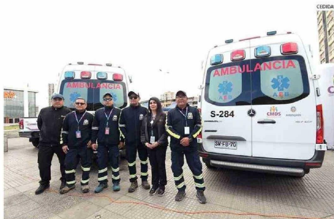
CON LAS MÁQUINAS SE BUSCA MEJORAR TIEMPOS DE RESPUESTA ANTE LA ALTA DEMANDA DE LA APS.

cremento en el número de personas inscritas, la directora agregó que comenzaron con prestaciones domiciliarias en junio pasado, "con la atención en domicilio en horario diferido desde las 17:00 horas hasta las 20:00 de lunes a viernes y sábado hasta las 14:00, por lo tanto estos vehículos nos permiten llegar a más hogares".