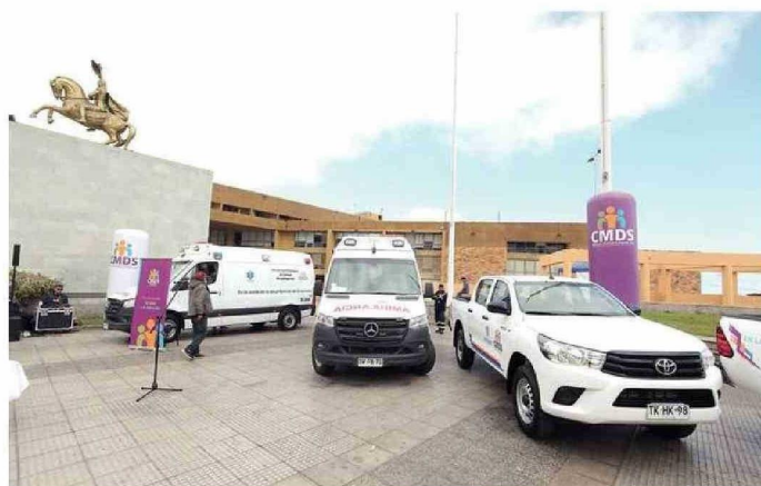
LOS NUEVOS VEHÍCULOS FUERON DESTINADOS A LOS CEFSAM DE ANTOFAGASTA.

Adquisición bordeó los $300 millones para potenciar atenciones frente al aumento de la demanda en la APS.