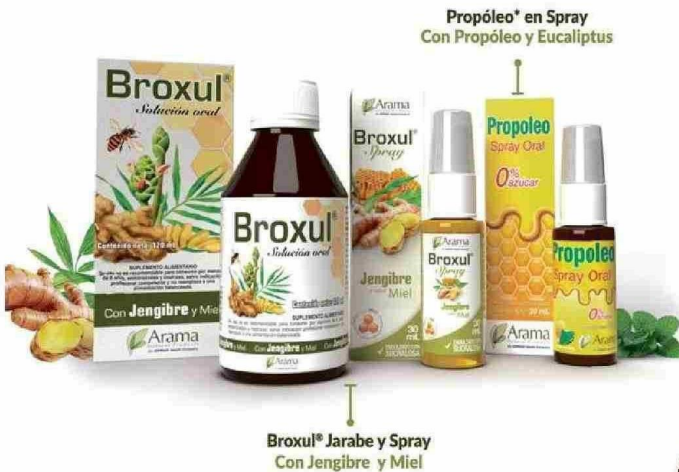
Propóleo* en Spray Con Propóleo y Eucalipto

Que este invierno el cuidado sea natural