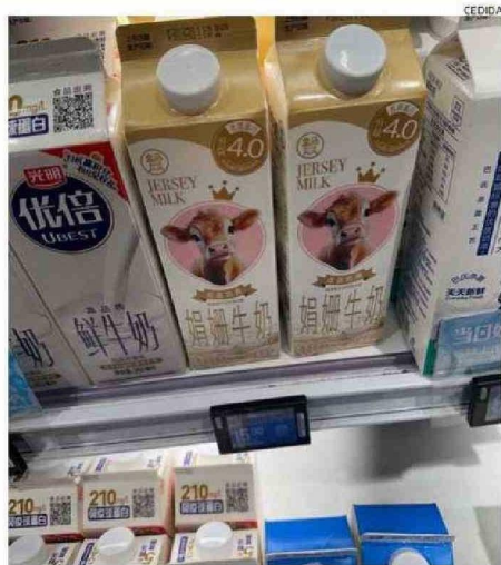
LECHES DE TODOS TIPOS SE VEN EN LAS GÓNDOLAS CHINAS.

que China retomará la senda del crecimiento económico, por lo tanto, el consumo de leche va a aumentar y así la leche nacional tiene una gran oportunidad de cubrir esa demanda.