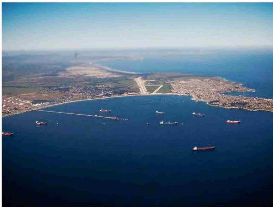
BAHÍA DE QUINTERO, DONDE SE PLANEA CONSTRUIR PLANTA DEMOSTRATIVA DE GENERACIÓN DE H2V.