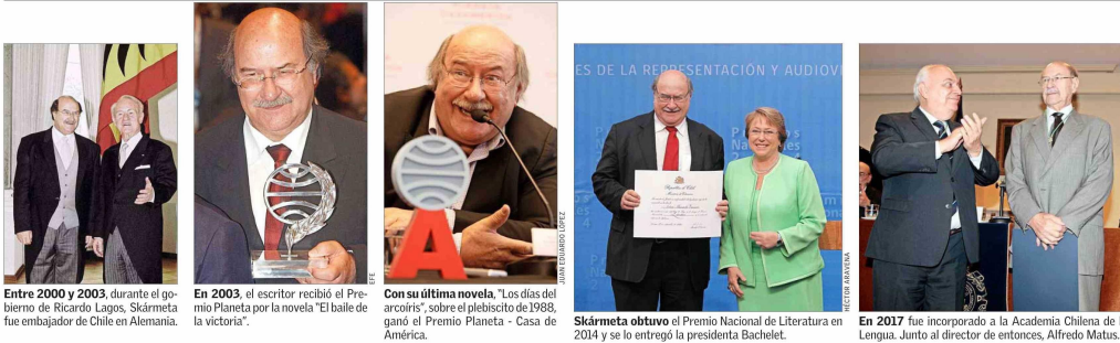
Entre 2000 y 2003, durante el gobierno de Ricardo Lagos, Skármeta fue embajador de Chile en Alemania.