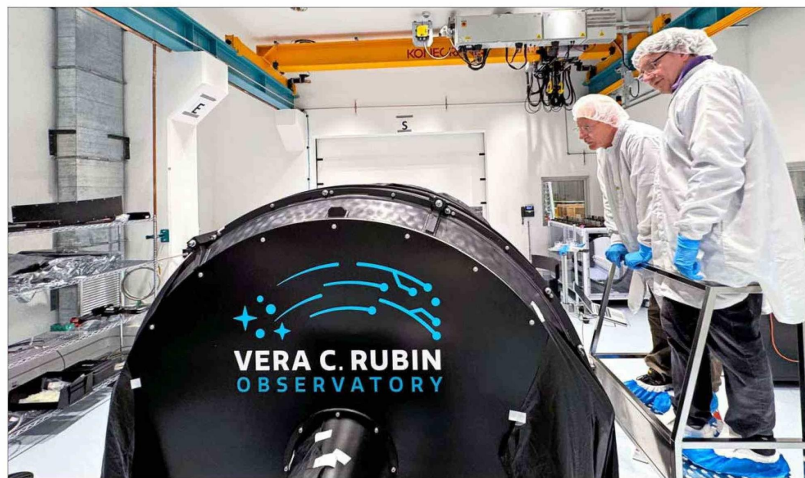
El telescopio Vera Rubin contará con la cámara más grande jamás construida para la astronomía. Se estima que podría inaugurarse en el segundo semestre del año y se ubicará en el Cerro Pachón, de la Región de Coquimbo.