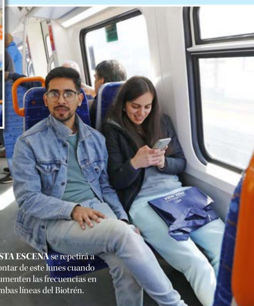
ESTA ESCENA se repetirá a contar de este lunes cuando aumenten las frecuencias en ambas líneas del Biotrén.