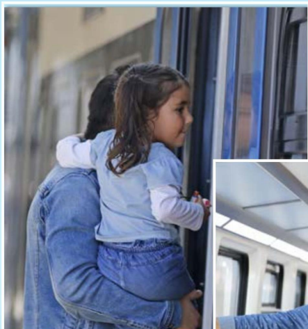
FAMILIAR ese sigue siendo una de las características más destacadas del tren de pasajeros que, pese a las dificultades del último periodo, sigue convocando.

Autoridades y vecinos de la zona participaron del recorrido que se inició en Concepción y llegó hasta San Pedro de la Paz para luego retornar a la estación penquista. La alegría por el retorno del viaducto y al trayecto habitual del Biotrén fue lo que predominó en la actividad.