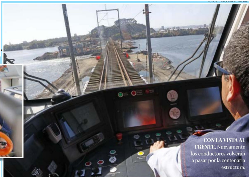
CON LA VISTA AL FRENTE. Nuevamente los conductores volverán a pasar por la centenaria estructura.

Gonzalo Pelén, departamento de Infraestructura Conma