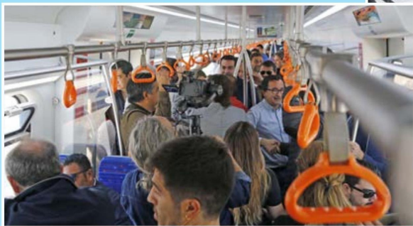
ENTUSIASMO y alivio hubo los pasajeros que fueron los primeros en recorrer nuevamente el tramo entre Concepción y San Pedro de la Paz.

RECORRIDO SE REALIZÓ SIN INCONVENIENTES Y MOSTRÓ QUE LA ESTRUCTURA ESTÁ RECUPERADA PARA SEGUIR EN SERVICIO