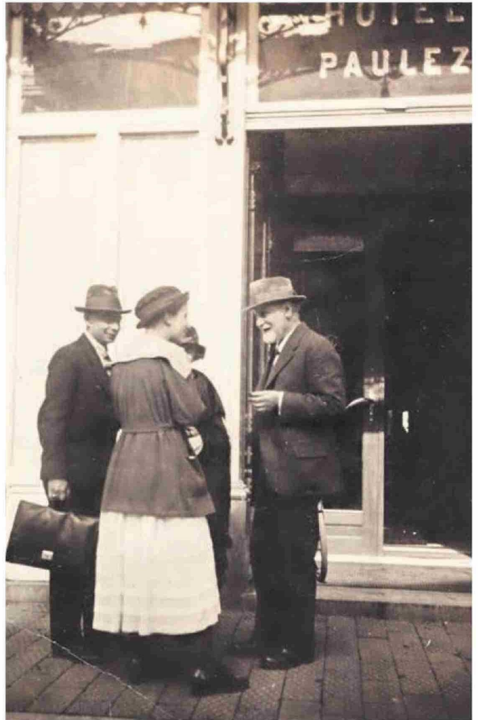
Rank fue un discípulo muy cercano a Freud, de quien se terminó distanciando.

—Por mi profesión siempre me ha interesado mucho la historia del psicoanálisis, y leyendo los diarios de Nin aparece aquel episodio ("Fuego", entre otros),