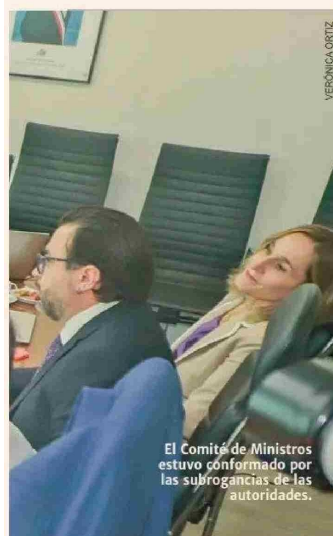
El Comité de Ministros estuvo conformado por las subrogancias de las autoridades.