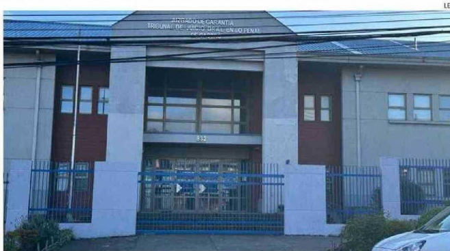
TRIBUNAL DE GARANTÍA DE CASTRO ACEPTÓ AMPLIAR LA DETENCIÓN POR TRES DÍAS.

Tras ello, la Fiscalía instruyó a peritos de la PDI realizar las diligencias que permitieran identificar a la víctima y dar con el paradero del responsable, identifica-