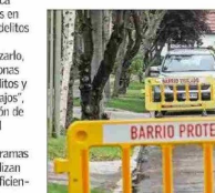
Las medidas de seguridad deben involucrar un esfuerzo mancomunado entre diversas instituciones, plantean especialistas.

Añade que "luego la estrategia debe considerar incentivos económicos para las familias y municipios para la reinserción escolar de jóvenes desahuciados, instalación de 'oficinas de oportunidades laborales' de cooperación público-privada para dar trabajos lícitos a jóvenes y adultos".