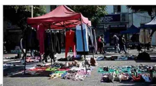
DERRUIDOS.— Sectores de la capital como Meiggs o la Vega Central se han deteriorado de la mano de la actividad informal.

Con distintos tipos de medidas, que van desde equipos de fiscalización hasta el aumento de permisos municipales, algunas autoridades han buscado enfrentar el fenómeno del comercio ambulante, que prolifera en barrios comerciales de las distintas ciudades.