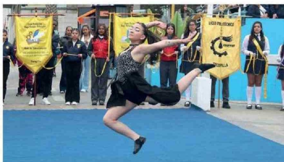
HUBO GRANDES MUESTRAS ARTÍSTICAS EN ESTE ACTO.