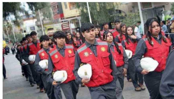
LOS “PORTEALANOS” FELICES DE SER PARTE DE LA EDUCACIÓN TÉCNICA PROFESIONAL.

serán importantes para la vida de cada alumno y sus familias.