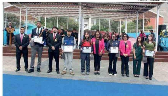
AQUÍ LOS ALUMNOS RECONOCIDOS DE CADA ESPECIALIDAD DEL POLITÉCNICO.