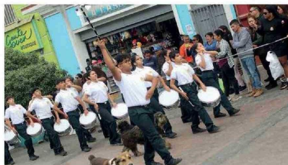
LA BANDA DE GUERRA “CAZADORES DEL DESIERTO” DIJO PRESENTE.