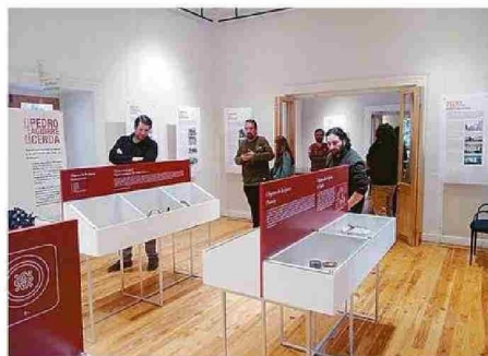
EXPOSICIÓN DE PERTENENCIAS DE PEDRO AGUIRRE CERDA.