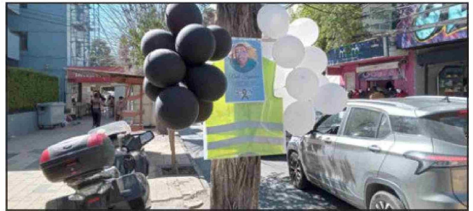
Globos blancos, negros con su foto en el árbol ubicado en el lugar donde se instalaba diariamente, ahí en calle Coimas, frente al Pasaje Juana Ross.

- Sí, es que el doctor, cuando lo llevé el día martes a urgencias, me dijo que estaba muy mal y grave. Me dijo «yo le puedo conseguir