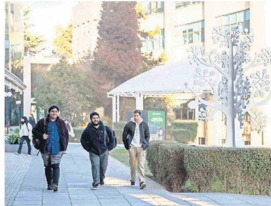
Para el proceso de admisión 2025 la carrera de Geología se sumará a la oferta de la sede Concepción de la USS.