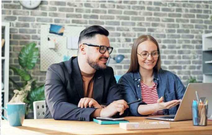
UNA LLAVE. — El inglés facilita la integración en entornos laborales multiculturales, abre puertas a posiciones de liderazgo y permite participar en equipos globales, lo que puede ser decisivo en un mercado cada vez más competitivo.

Y es que el dominio del inglés tiene un impacto directo en sectores clave para la economía chilena, como minería, tecnología, comercio exte-