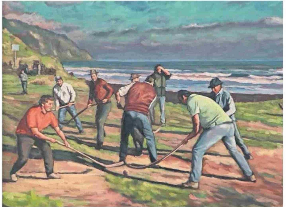
OBRA DE DIONICIO ZAMBRANO