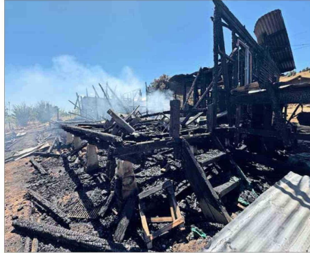
LA ARAUCANÍA. — En Lumaco, el 6 de enero, encapuchados entraron a la casa de un campo, obligaron a los ocupantes a salir y la quemaron.

“El problema es que están intercambiando tácticas y técnicas delictuales entre las zonas sur y central. Esto hace predecir un incremento de estas acciones en el mundo rural”.