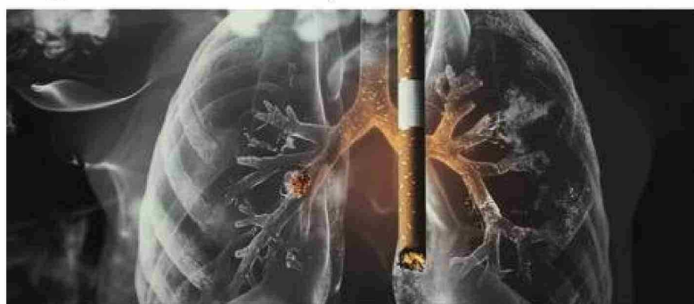
Se usaron datos del Observatorio Mundial del Cáncer sobre los casos de cáncer en 185 países/territorios de todo el mundo.

los hombres participan menos en actividades de prevención del cáncer subutilizan las opciones de tests y tratamientos enfrentan una mayor exposición a factores de riesgo del cáncer como el tabaquismo, el consumo de alcohol y la exposición laboral a agentes cancerígenos