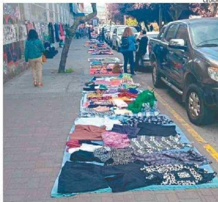
COMERCIO AMBULANTE SE INSTALA MUY TEMPRANO EN JANEQUEO.