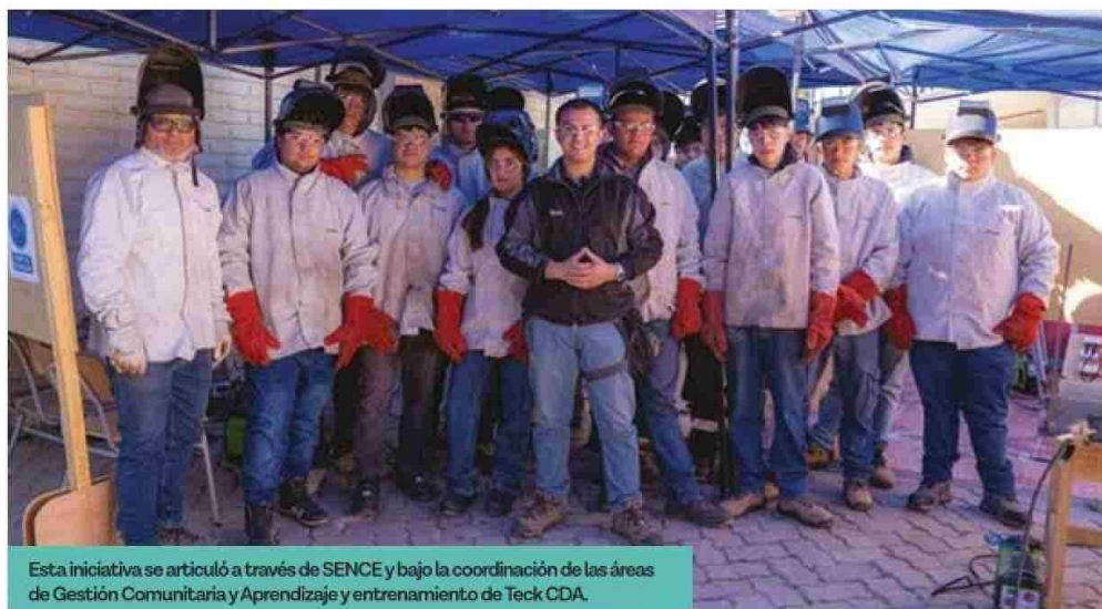
Esta iniciativa se articuló a través de SENCE y bajo la coordinación de las áreas de Gestión Comunitaria y Aprendizaje y entrenamiento de Teck CDA.