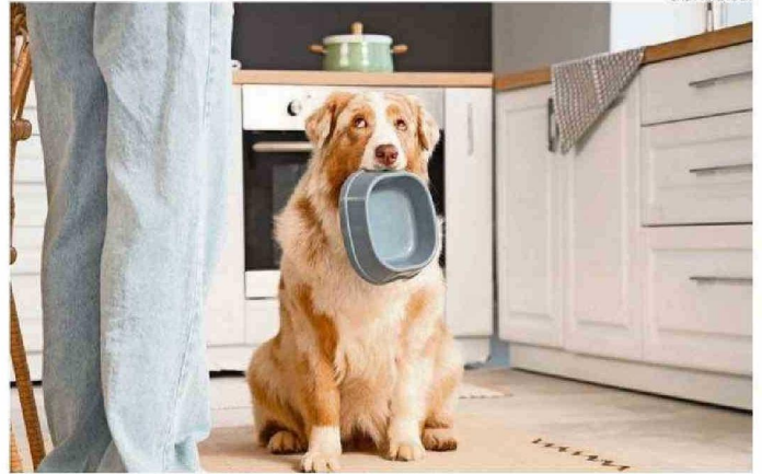
LOS PLATOS DE COMIDA ALOJAN MICROORGANISMOS Y RESIDUOS.