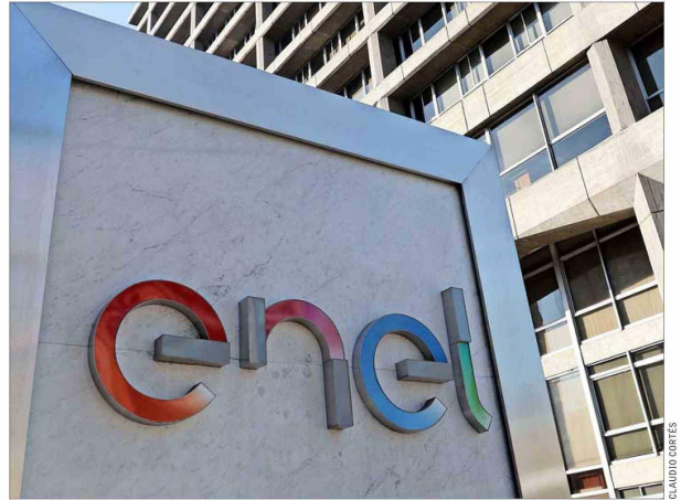
DESDE EL GOBIERNO.— señalaron que, además, se abre una arista penal para Enel producto del incumplimiento de la Ley de Electrodependientes.