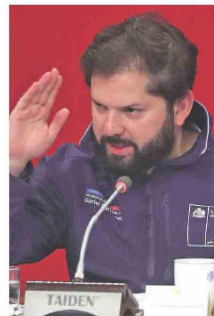
El Presidente habló desde EE.UU. por el caso.

Hoy, Marcela Cubillos postó que “Parlamentarios de izquierda quieren convertir en delito el sueldo de sus adversarios y terminar con la libertad de educación y de trabajo. El octubrismo igual de